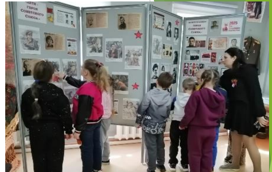
Дом молодежных организаций