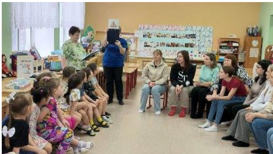
МБУК Алексеевский РДК